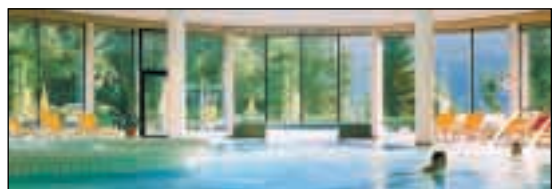
Moderne Architektur sorgt für ein zusätzliches Wohlfühl.

A-6870 Reuthe im Bregenzerwald Tel.: +43 (0)5514 2265-0, www.badreuthe.at