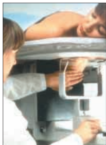
Screening-Untersuchungen gegen Brustkrebs.