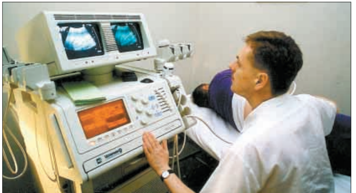
Vorarlberg nimmt in der Vorsorgemedizin bereits eine Vorreiterrolle ein.

Allerdings wird diese schwerpunktmäßige Ausrichtung in den nächsten Jahrzehnten auf immer größere Schwierigkeiten stoßen. Vor allem bedingt durch die Veränderung des Krankheitspektrums aufgrund der steigenden Lebenserwartung. Dadurch wächst der Anteil von Langzeiterkrankungen („chronische Krankheiten“), die durch unser auf Therapie ausgerichtetes Gesundheitswesen nur schlecht behandelbar sind. Gleichzeitig führen chronische Krankheiten zu