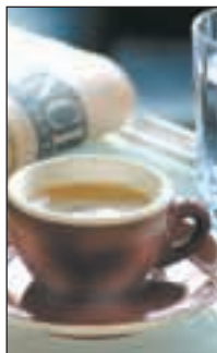
Kaffee nicht zum Durst löschen.

Schwarzach (VN) Nach einem Schlaganfall sollten Patienten, denen Aspirin verordnet wird, sich an die regelmäßige Einnahme des Medikaments halten. Patienten, die das blutverdünnende Mittel absetzen, haben nach einer Schweizer Studie ein um das Dreifache erhöhtes Risiko, einen Rückfall zu erleiden.