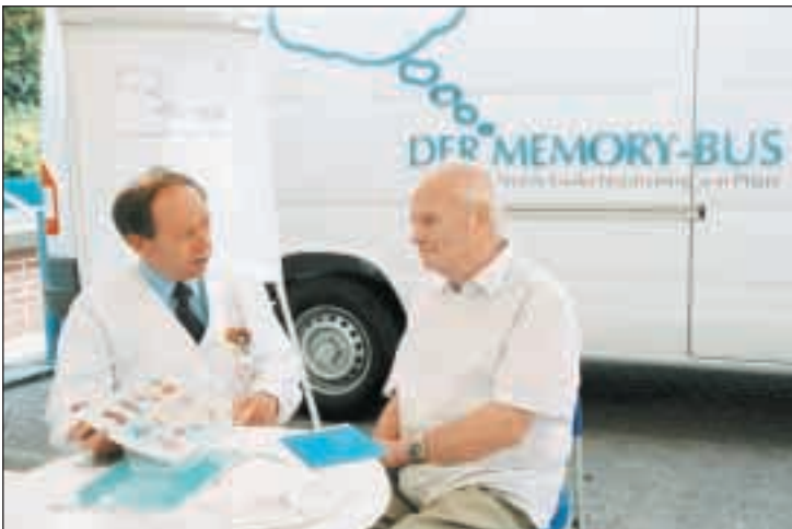
Der Memory-Bus gastiert auch zwei Tage in Vorarlberg.